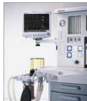
Крепление к наркозно-дыхательному аппарату