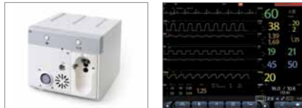
Модуль измерения смеси газов (мультигаз), O 2 , BIS