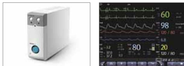
Модуль CCO/SvO 2