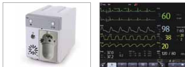
Модуль измерения CO 2