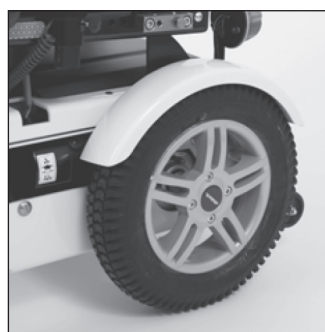
EA 10 Комплект брызговиков