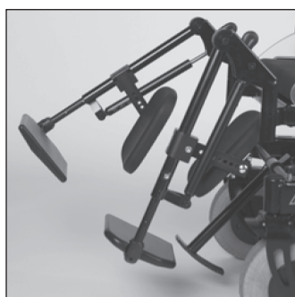
EB 20 Подножки с механической регулировкой угла наклона в коленном суставе