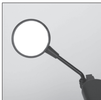
ES 38 Зеркало заднего вида