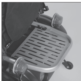
ES 42 Багажник