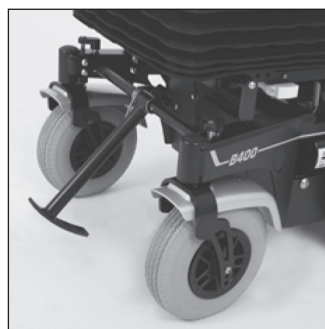
EF 04 Устройство для преодоления препятствий до 10 см