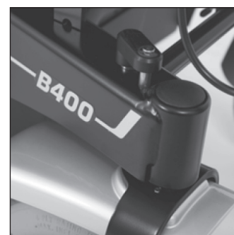
EF 03 Механический ограничитель поворота передних колес