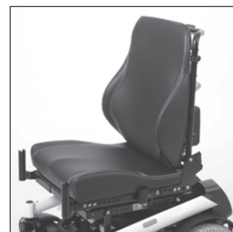
EC 26 Эргономичное контурное сиденье