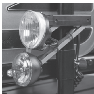
ES 05 Электроосвещение