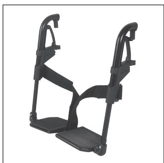
EB 02 Раздельные подножки с алюминиевыми опорами для стоп