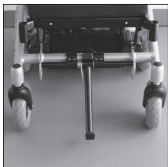
EF 07 Устройство для преодо- ления препятствий