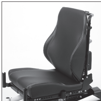
ЕС 24 Контурное сиденье с выраженными контурами