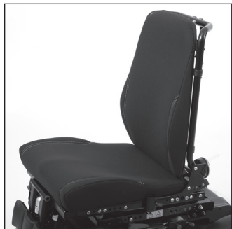
ЕС 23 Контурное сиденье с невыраженными контурами