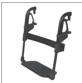
EB 03 Сплошная подножка с алюминиевой опорой для стоп