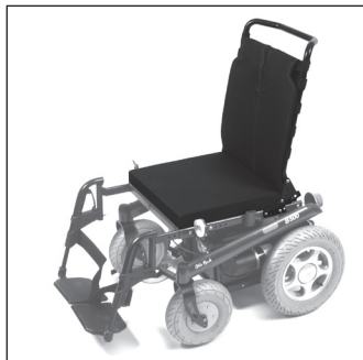
ЕС 01 Стандартное сиденье