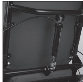
ED 20 Механическая регулировка угла наклона спинки 30°