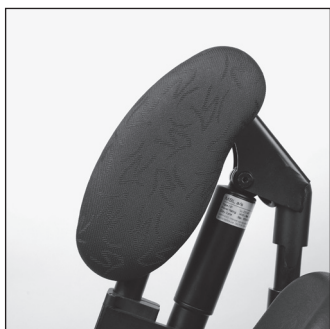
EB 80 Мягкие опоры для ко- леней