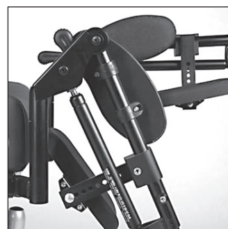
EB 20 Механическая регулировка угла наклона подножек в коленном суставе