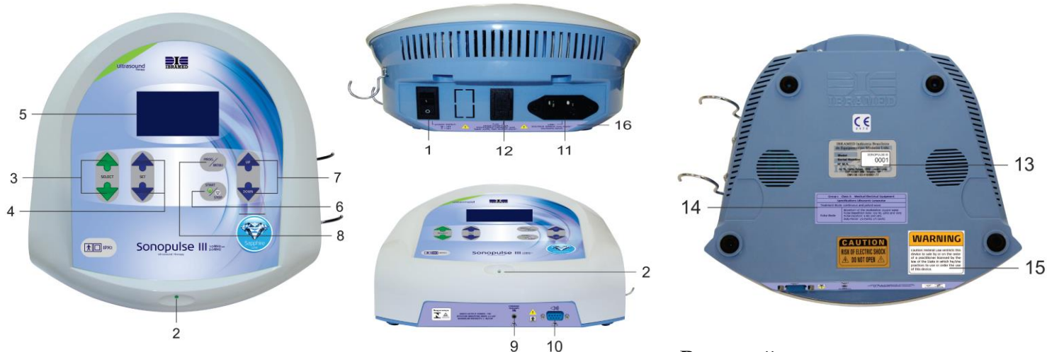
Внешний вид аппарата